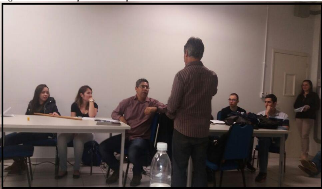
Figura 4: Socialização e avaliação da atividade