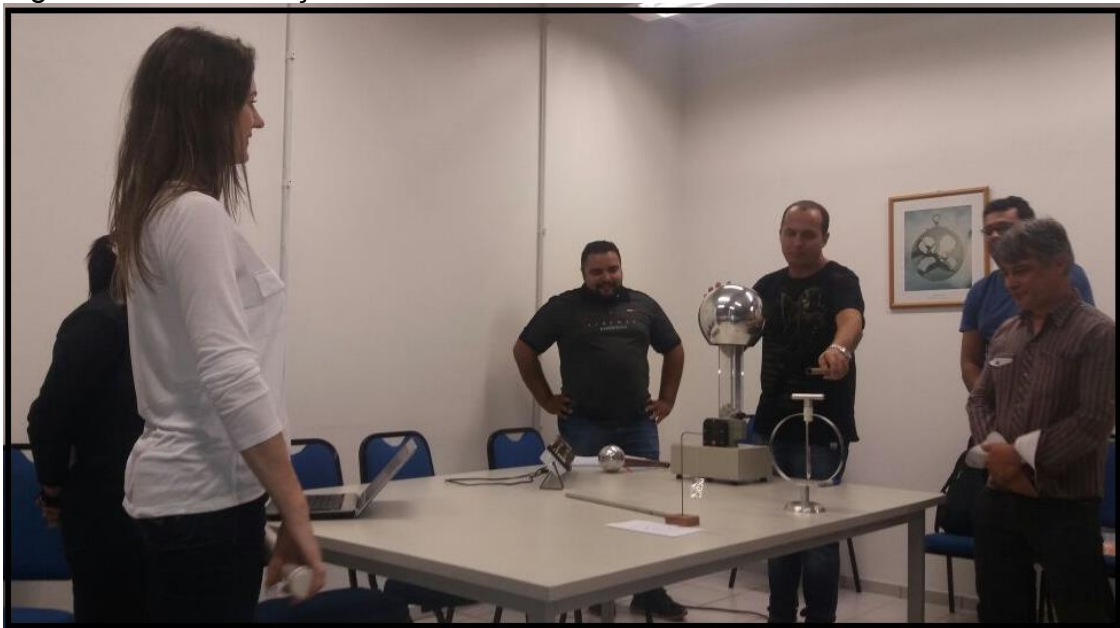
Figura 3: Demonstração Prática.