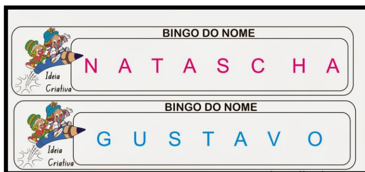
Figura 4 - Bingo dos nomes

Fonte: < http://sojogopedagogicos.blogspot.com.br > Acesso em: 12 jun. 2018.