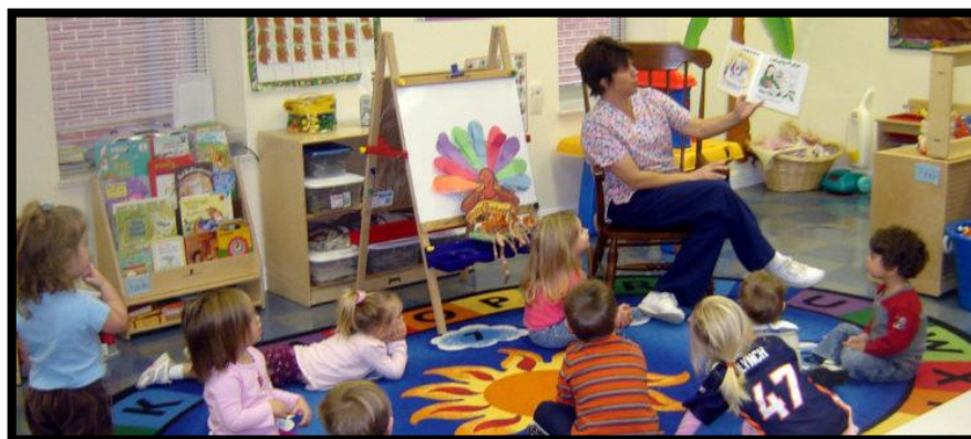
Figura 1 - Momento de leitura

Fonte: < https://www.gwinnettpl.or > Acesso em: 12 jun. 2018.