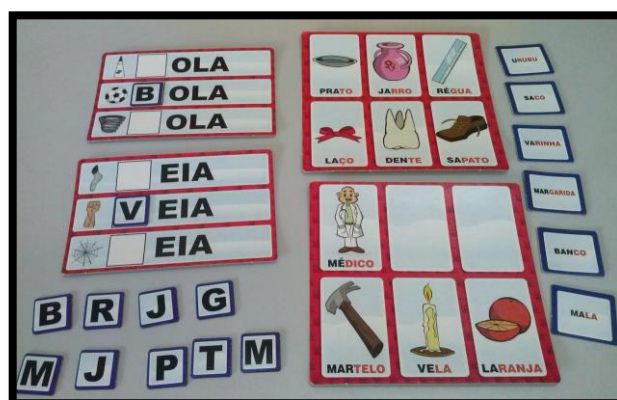
Figura 3 - Jogo das letras e palavras

Fonte: < http://aee2013ludovicense.blogspot.com.br > Acesso em: 12 jun. 2018.