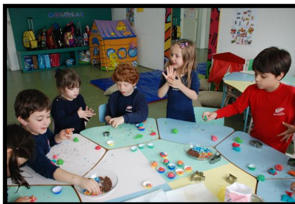
Figura 5 - Brincando com massinha de modelar